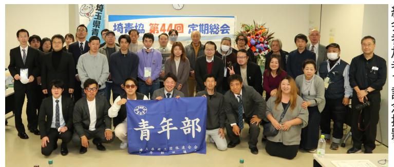
総会参加者で記念撮影

税務調査の連絡は、携帯電話・スマホにかかってくることもあります。スマホの電話帳に登録しておけば、電話がかかってきたときに「あっ、税務署からだ…！」と電話に出る前にひとつ心構えができるのです。税務署から電話がかかってくれば、どんな人でも驚き、不安になります。小さなことですがこれだけでも大分ショックを和らげられます。パネリストで参加していたある会員さんは「車に従業員や下請けさんを乗せて運転していた時に電話がかかってきて、スピーカーフォンで電話を取ったら税務署からの調査の連絡だった。同乗者に会話が丸聞こえで非常に気持ち悪い思いをした」と話してくれました。